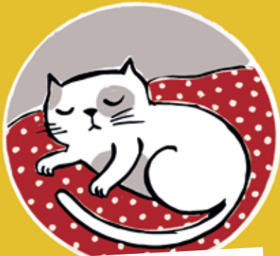
LA GATA BLANCA