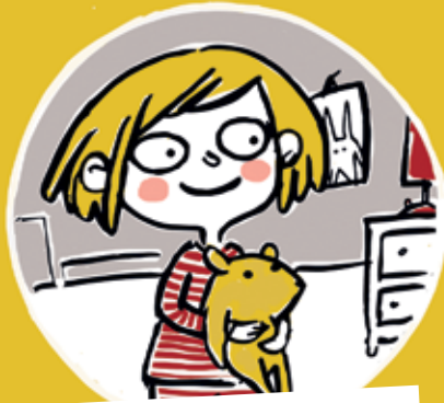
LA CATERINA I L'OS